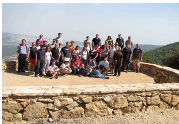
Die Teilnehmer des Symposiums auf einem Ausflug zum Berg Meron in Obergaliläa.

The wide range of subjects included intelligent surfaces for sensors, new nanotubes and nanoparticle systems, biomolecular functionalization and sensor applications of semiconductor field-effect transistors, and biomimetic platforms based on lipid membranes. A large number of student collaborations were agreed on before the end of the event. During the subsequent discussion, the participants unanimously spoke out in favour of repeating the symposium in 2009.