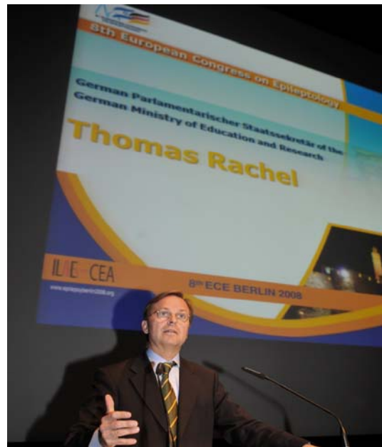
Der Parlamentarische Staatssekretär bei der Bundesministerin für Bildung und Forschung Thomas Rachel auf dem 8. Europäischen Epilepsiekongress in Berlin.

Die zentralen wissenschaftlichen Themen drehten sich um das Motto des Symposiums „Epilepsie als Krankheit und als Modell“ und betrafen einerseits genetische Aspekte der